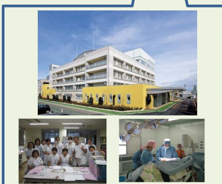
伊勢崎佐波医師会病院